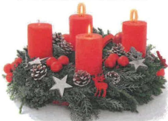
Exemple de Couronne de l'Avent (à poser)