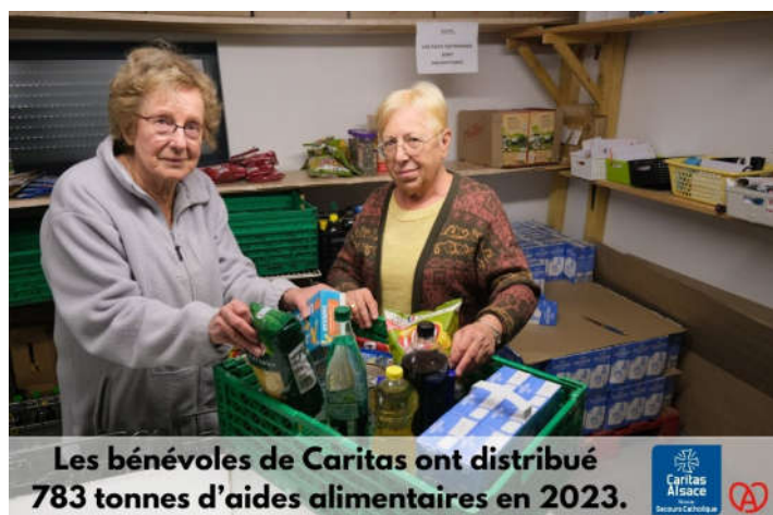
Les bénévoles de Caritas ont distribué 783 tonnes d'aides alimentaires en 2023.

Pour rappel, tout don à Caritas Alsace, organisme reconnu d'intérêt général, donne droit à une réduction d'impôt de 75% (et 66% au-delà de 1000€). Un don de 100€ ne coûte donc plus que 25€ après impôt. Don sécurisé sur caritas-alsace.org , ou par chèque à l'ordre de Caritas Alsace, 5 rue St-Léon, 67082 Strasbourg Cedex.