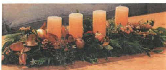
Exemple de Chemin de Table