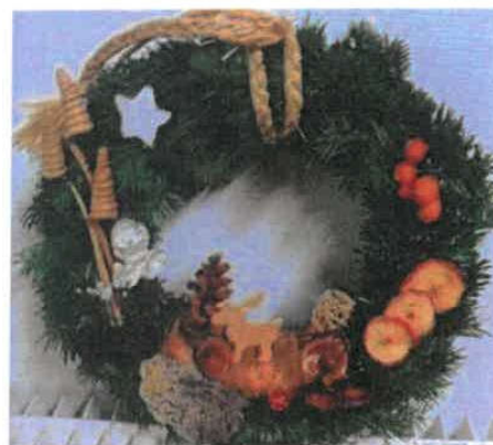
Exemple de Couronne d'Accueil (à suspendre)