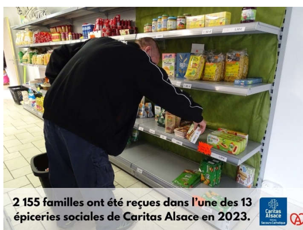
2 155 familles ont été reçues dans l'une des 13 épiceries sociales de Caritas Alsace en 2023.