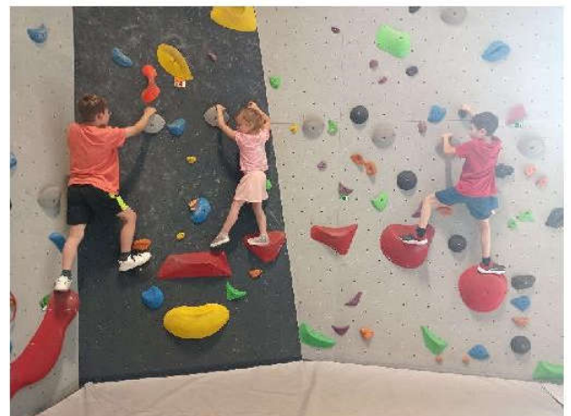
Déplacements latéraux sur un parcours balisé

Cette sortie a été financée grâce à un don de l'Association des P'tits Loups de Stotz et une participation de la coopérative scolaire. La mairie a, quant à elle, payé le transport en bus. Les élèves et leur enseignante les remercient d'avoir contribué à la réalisation de cette superbe journée sportive.