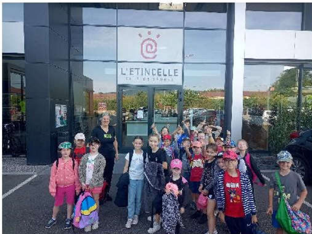
Arrivée à 9h au complexe sportif

Les élèves de CP-CE2 de l'école élémentaire de STOTZHEIM