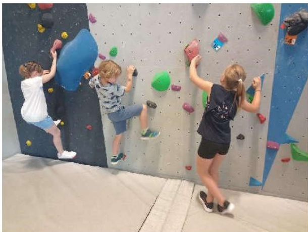
Découverte du bloc et des prises les plus basses